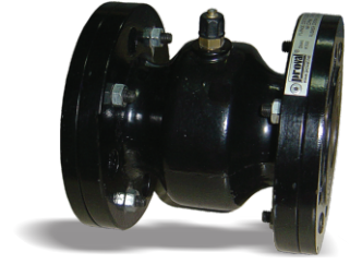
Flanşlı Pinch Valf

Pnömatik Pinch valflerde beslenme basıncı, hat basıncından min. \Delta p 1,5 bar fazla olmalıdır.